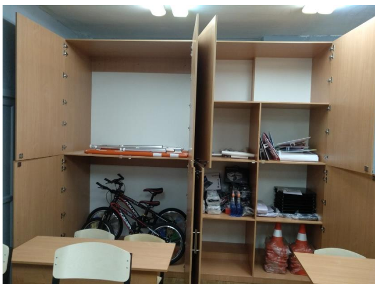
Кабинет15. Для занятий ПДД

В марте 2021г. подведены итоги конкурса на предоставление субсидий из областного бюджета на создание условий для вовлечения обучающихся образовательных организаций в деятельность по профилактике дорожно-транспортного травматизма. По итогам конкурса городу Коряжме выделены средства областного бюджета в размере 393880,00 рублей, на приобретение оборудования для кабинета безопасности дорожного движения в МОУ «СОШ №2». Софинансирование из местного бюджета составило 64120,00 рублей. (постановление администрации города от 20.10.2017 № 1500 «О муниципальной программе «Развитие образования в городе Коряжме на 2018–2023 годы»).